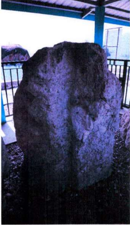
Foto objek tampak belakang

(sumber : Laporan Akhir Inventarisasi Data Warisan Budaya Benda Pagar Alam, BPK Wilayah VI, 2023)