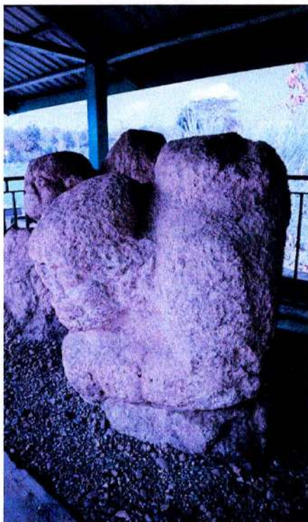
Foto objek tampak samping

(sumber : Laporan Akhir Inventarisasi Data Warisan Budaya Benda Pagar Alam, BPK Wilayah VI, 2023)