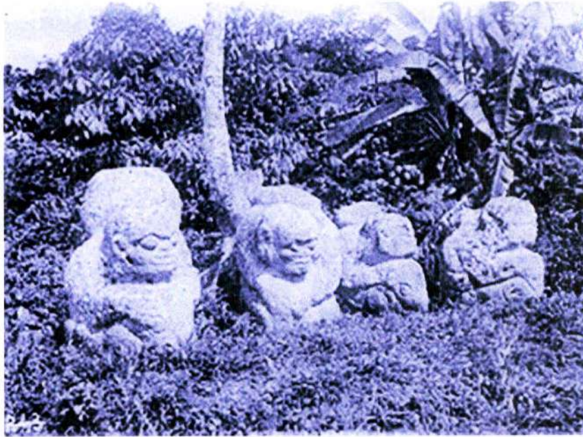
Foto keletakan objek sekitar tahun 1931