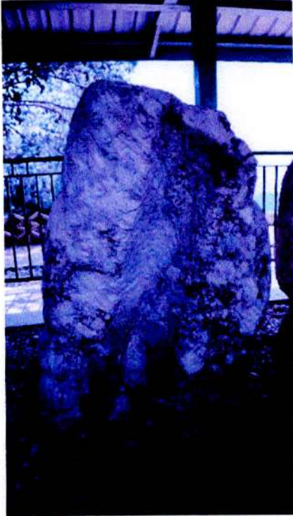
Foto objek tampak belakang

(sumber : Laporan Akhir Inventarisasi Data Warisan Budaya Benda Pagar Alam, BPK Wilayah VI, 2023)