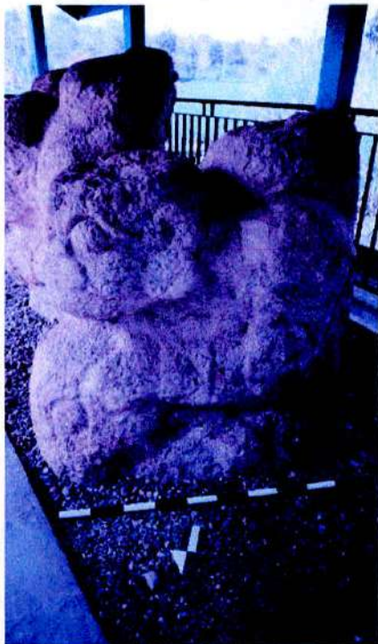
Foto objek tampak samping

(sumber : Laporan Akhir Inventarisasi Data Warisan Budaya Benda Pagar Alam, BPK Wilayah VI, 2023)