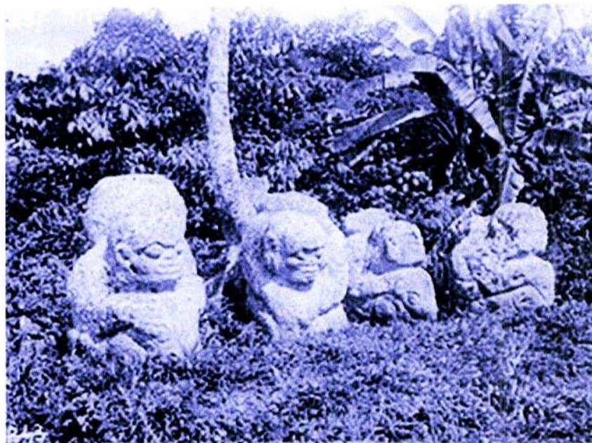
Foto keletakan objek sekitar tahun 1931