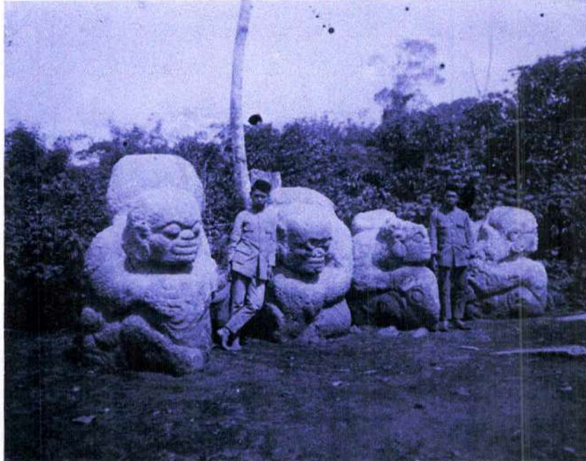
Foto objek tampak depan