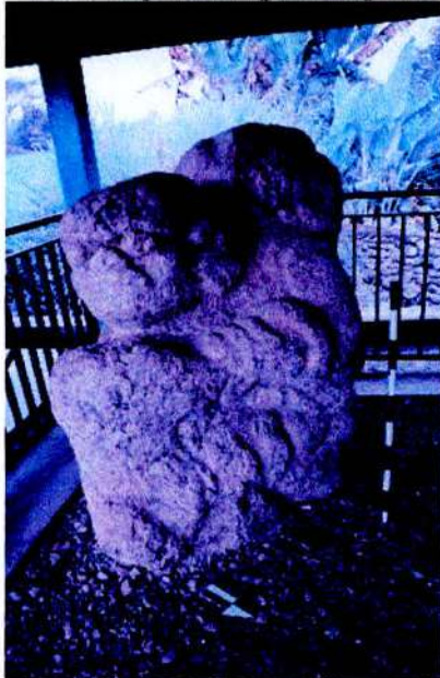
Foto objek tampak depan

(sumber : Laporan Akhir Inventarisasi Data Warisan Budaya Benda Pagar Alam, BPK Wilayah VI, 2023)