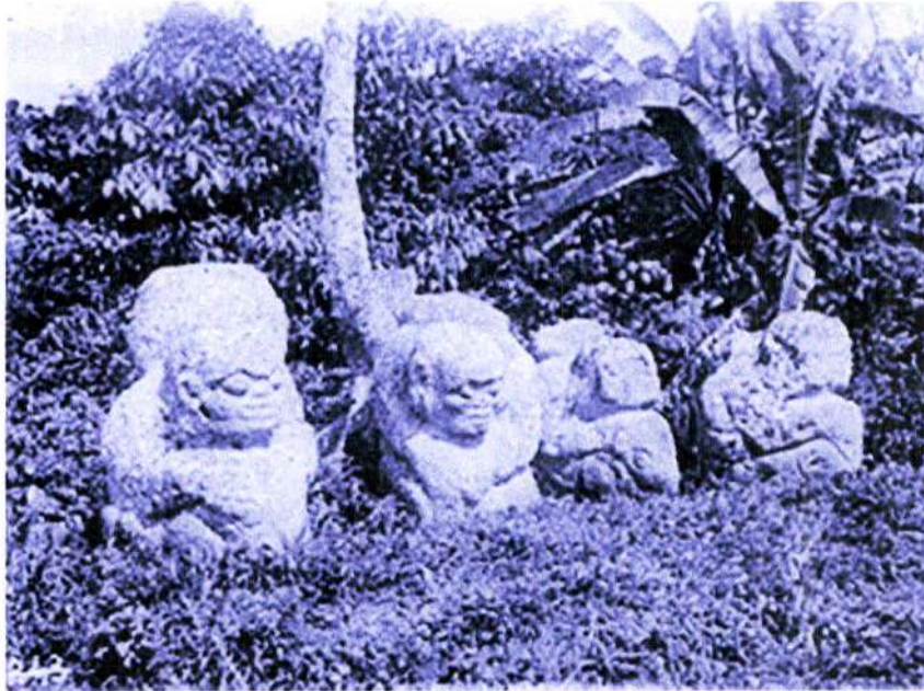
Foto keletakan objek sekitar tahun 1931