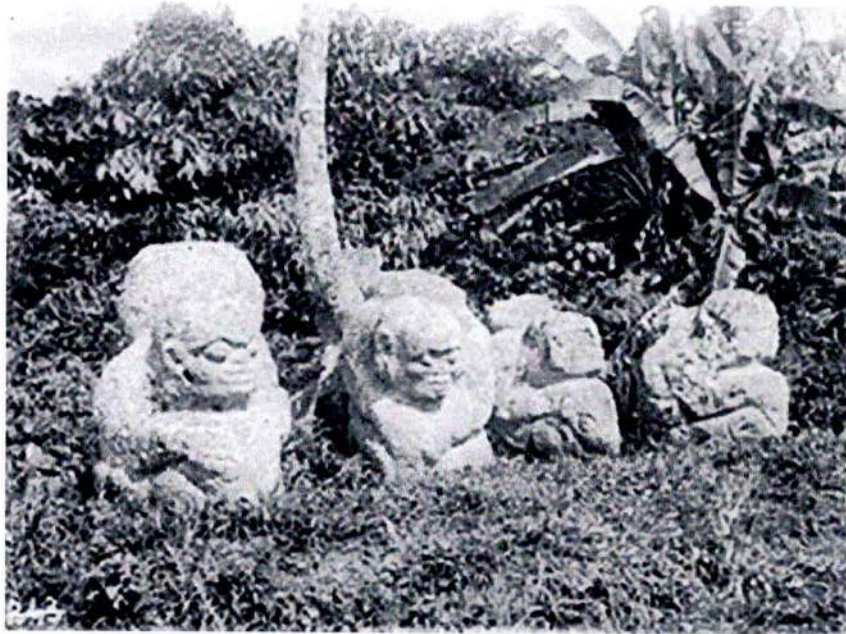
Foto keletakan objek sekitar tahun 1931