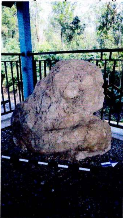
Foto objek tampak samping

(sumber : Laporan Akhir Inventarisasi Data Warisan Budaya Benda Pagar Alam, BPK Wilayah VI, 2023)